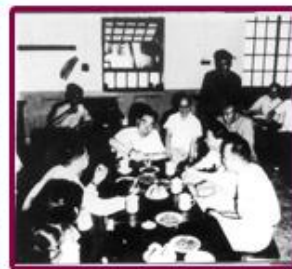
1959年5月28日，周总理 视察南开大学，在职工食 堂吃饭。