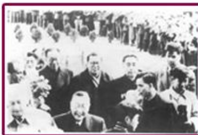
1957年4月10日，周总理 陪同波兰政府代表团来到天津。