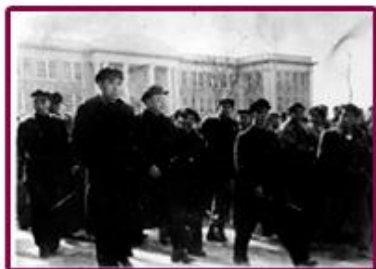
1951年2月24日，周总理 视察南开大学。